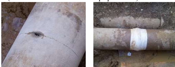
riparazione di un tubo fognario in cemento amianto

Innegabili sono i vantaggi che ne derivano dalla riparazione senza taglio di condotte in cemento amianto, dove il problema dell'esposizione alla lavorazione è particolarmente sensibile. Non importa se la superficie è liscia o curva, se si tratta di una perdita su un bicchiere o su una derivazione; la fascia si adatta a tutte le situazioni ed è utilizzata non solo per riparare, ma anche per rinforzare la struttura della rete che presenta segni di cedimento strutturale o corrosione.