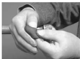
manipolare con le mani