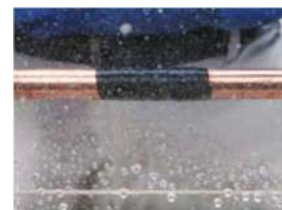
procedere manipolando per amalgamare fine dell'intervento