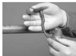
amalgamato risulterà bianco