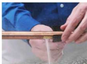
prendere il nastro PTS e avvolgerlo sul tubo togliendo la pellicola protettiva