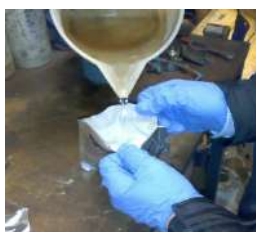
versare acqua per attivare