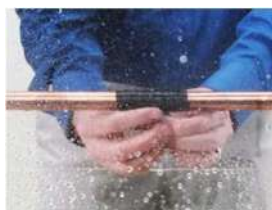
incrociare tra i due punti di appoggio e avvolgere fino a chiusura della perdita