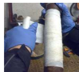
manipolare con cura