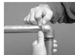
applicare con forza sull'area

Lavorazione – prendere lo stick Putty-Revolution e tagliarlo a misura nella quantità occorrente all'intervento; manipolare con le mani per attivare il prodotto fino a quando la miscela avrà assunto una colorazione omogenea. Imprimere sulla superficie precedentemente pulita eliminando oli, grassi, ruggine. Il materiale indurito è lavorabile meccanicamente (foratura, levigatura, fresatura) ed è verniciabile senza pretrattamento.