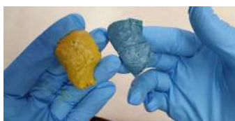
dosare i due componenti 1 : 1

Green-Putty è una resina epossidica bicomponente caricata con polveri minerali per intervenire nella chiusura di buchi o intercapedini e nella ricostruzione dello spessore delle pareti delle condotte metalliche corrose dalla ruggine o da correnti vaganti. La particolare mescola di cui è composto consente di ricreare le condizioni ottimali per prolungare la vita della condotta. Il prodotto si presenta nella pratica confezione a due panetti bi-colori, il blu ed il giallo; rapporto di miscelazione di 1:1 ; in funzione omogenea dell'intervento prelevare la quantità necessaria e manipolare a mano per attivarlo; una volta attivato (raggiunge una colorazione verde), deve essere immediatamente applicato sul foro, la parte da ricostruire o da rinforzare plasmandolo con le mani. È idoneo per sigillare tubazioni e serbatoi ; può essere applicato su metallo, legno, vetro, gomma, ceramica, calcestruzzo e a tanti tipi di plastica. È resistente alla benzina, petrolio, estere, salsedine e a gran parte degli acidi e soluzioni alcaline, una volta polimerizzato è lavorabile meccanicamente e verniciabile; resistente a temperature fino a +200°C.