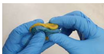
manipolare con le mani