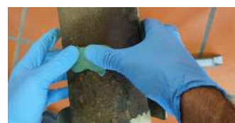
applicare con forza sulla superficie