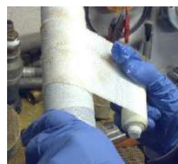
avvolgere WSG sul tubo