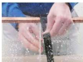
tirare il nastro PTS per attivarlo creare punti di appoggio a monte e valle