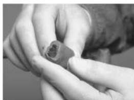
togliere la protezione