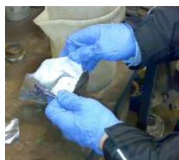
aprire la busta sigillata