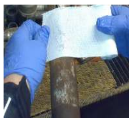
posizionare la fascia WSG