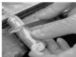
tagliare la quantità occorrente